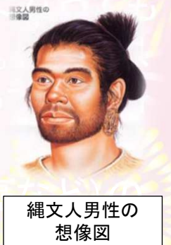
縄文人男性の 想像図

もちろん、退化傾向だけが原因ではなく、様々な要因が口腔機能を損ないます。口腔内には歯、歯を支える粘膜、骨(歯周組織)、顎を動かすための筋肉、唾液腺などがあり、それらがなくなると栄養がとりにくく、ひいては寿命にも影響します。そこで、日本歯科医師会は8020運動「80歳になっても20本以上自分の歯を保とう」を推進しています。20本以上歯が残っていれば機能が保たれます。頑張っ歯と口の健康を守りましょう。